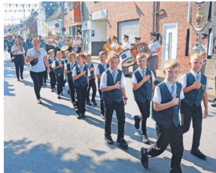
Neben zwölf Jungschützen der ganze Stolz des BSV Delhoven: Nach der Pandemie ist die Zahl der Edelknaben wieder auf 31 angewachsen.

AUTOHAUS Heinen GMBH. Einen Toyota von Heinen oder keinen!