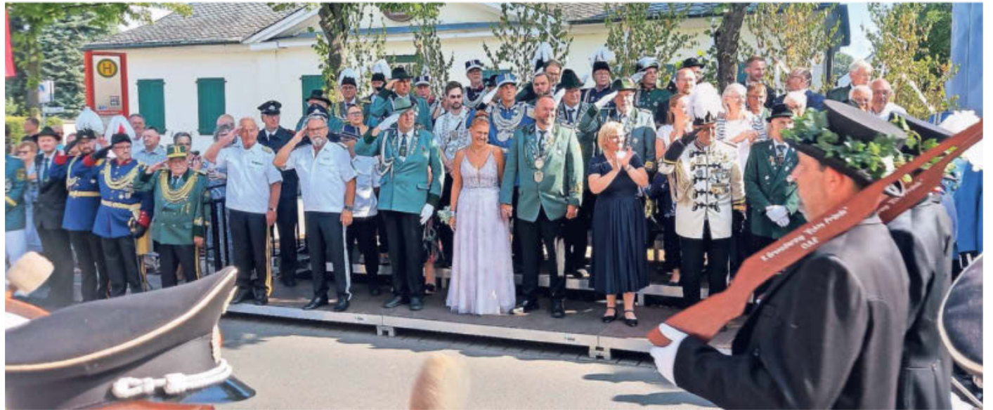
Schon beim Morgenappell vor der gelungenen Frühparade am vergangenen Sonntagvormittag zeigte das Thermometer 23 Grad Celsius. Das konnte nicht nur dem strahlenden Königspaar, sondern auch der gesamten Delhovener Schützenfamilie die gute Laune nicht verderben.