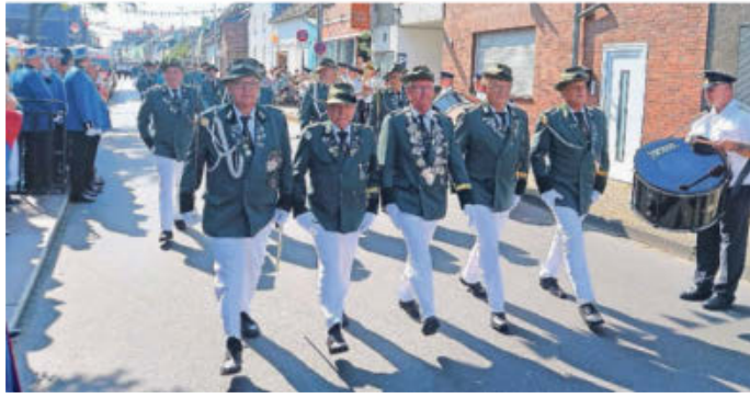
Der 12. Jägerzug, der den Namen „Treue Kameraden“ trägt, feiert in diesem Jahr stolz sein 50-jähriges Bestehen.